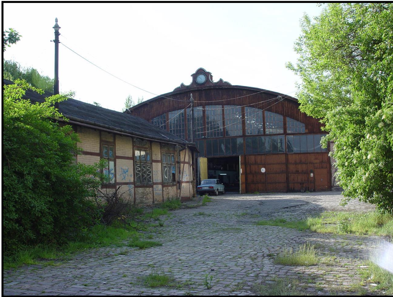
Zdj: Referat ds. Rewitalizacji, 2005 r. Zagadka: który to obiekt?

Kwartał św. Wawrzyńca – budowa centrum kulturowego na krakowskim Kazimierzu - Kompleks zajezdni tramwajowych z 2 poł. XIX i pocz. XX w., którego dotyczy projekt, leży na terenie uznanym za pomnik historii „Kraków - historyczny zespół miasta”, na krakowskim Kazimierzu, i wpisany jest do rejestru zabytków oraz na Listę Światowego Dziedzictwa UNESCO.