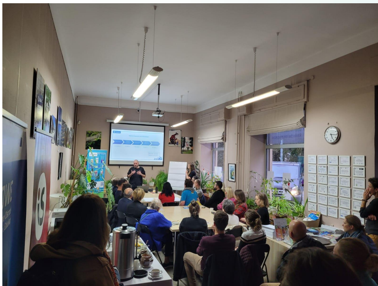
Jesienne warsztaty rewitalizacji w siedzibie MIS

Fundacja złożyła do GPRMK przedsięwzięcie pn. Lokalny Ośrodek Wiedzy i Edukacji (LOWE Wesola) . Krótko o projekcie: Przedsięwzięcie polega na stworzeniu miejsca edukacji, aktywności obywatelskiej i społecznej, aktywności indywidualnej i grupowej jako narzędzia do rozwiązywania zdiagnozowanych problemów społecznych. W ramach projektu zaplanowano stworzenie Lokalnego Ośrodka Wiedzy i Edukacji na podstawie Modelu MEiN, którego Fundacja MIS jest współautorem i jego implementacja odbędzie się w warunkach miejskich.