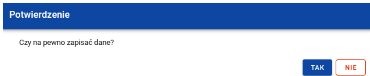
Rysunek 5. Komunikat potwierdzający zapisanie danych we wniosku o płatność