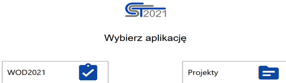
Rysunek 1. Widok ekranu startowego

Wnioski o płatność dostępne są w systemie CST2021 w aplikacji Projekty.