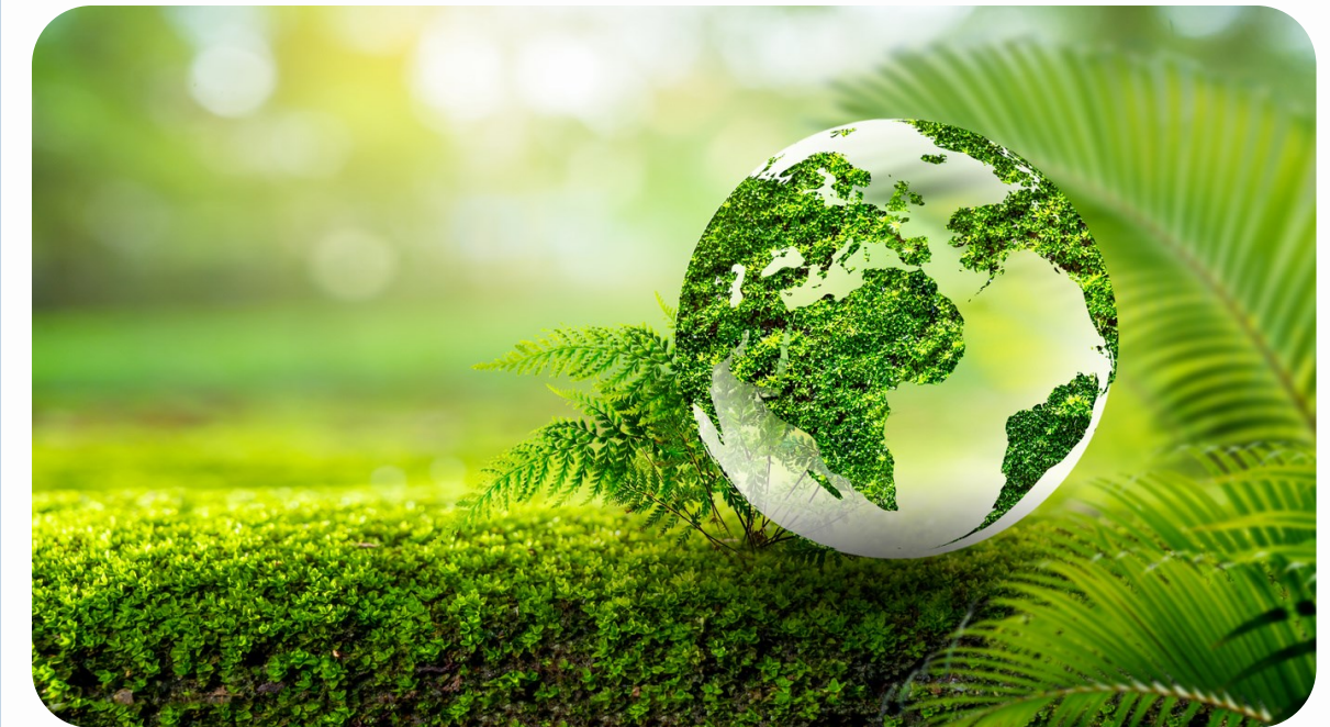
Zespół ds. zasady DNSH

Członek/członkini grupy zadaniowej może przynależeć do kilku zespołów równocześnie