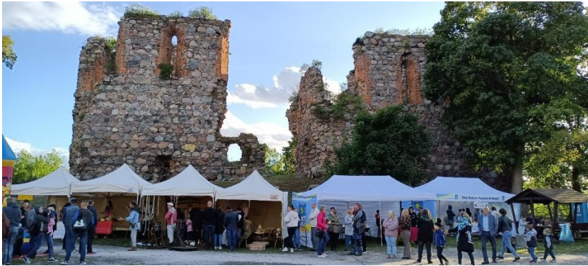
Festyn ginących zawodów w gminie Papowo Biskupie