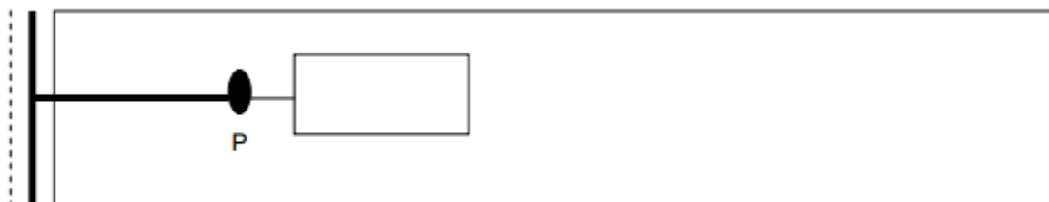
Rysunek 2. Kanalizacja ciśnieniowa

Pogrubione odcinki sieci stanowią element kwalifikowalny P - przepompownia